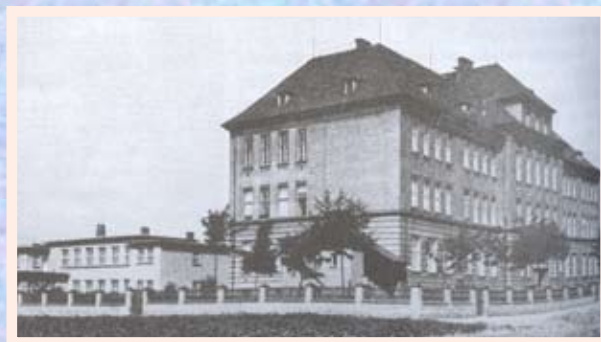
Hálkova škola sloužila jako shromaždiště před transporty do Terezína.

Když jsem se vrátila z koncentráku, měla jsem 35 kg. Spolužáci, které jsem potkala, mě ani nepoznali. Ke známým, s nimiž jsme byli zadobře, jsem se šla zeptat, jestli tam nezůstalo něco po rodičích. Ti mi všechno zapřeli, tak jsem si musela všechno vybudovat.