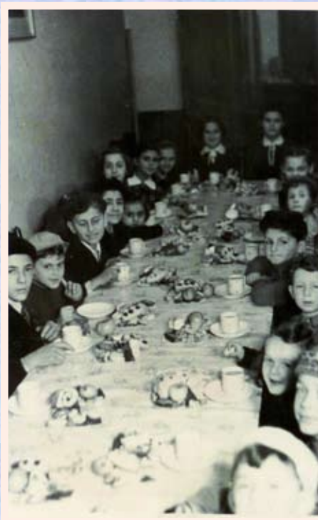
Purim v synagoze