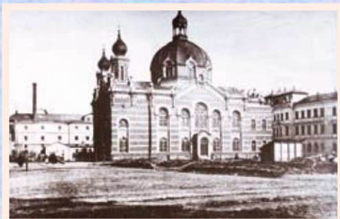
Synagoga na náměstí Marie-Terezie (dnes Palachovo náměstí)