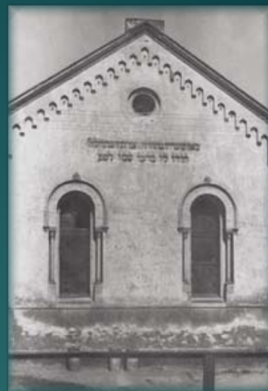
Synagoga před rekonstrukcí

Na okraji bývalého ghetta se do dnešní doby zachoval jeden z největších a nejstarších hřbitovů v České republice. V jeho jednadeceti nestejných řadách se nachází 1077 náhrobních kamenů. Na nejnovější kamenné desce jsou vytesána jména obětí holocaustu.